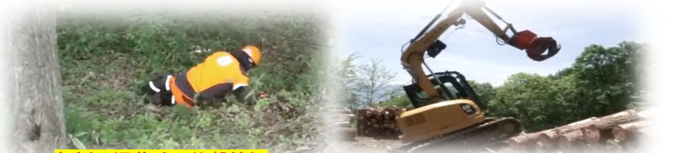
転倒や滑落時の衝撃検知